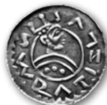
Nejstarší svědectví o Vyšehradě přináší denáry z vyšehradské mincovny z přelomu tisíciletí.

Vyšehrad leží na pravém břehu Vltavy v nadmořské výšce asi 230 m tam, kde Pankrácká pláň vyběhává k severozápadu dlouhým ostrohem vklíněným mezi řeku a údolí potoka Botiče. Severní, západní i jižní svahy návrší jsou velmi strmé. Na jihozápadě skála padá ze 40 metrů přímo do Vltavy. Barokní hrady ukrývají nejen kasemata, ale vysokými valy je obezděný středověký kostel Stětí sv. Jana Křtitele. Perlou Vyšehradu je románská rotunda sv. Martina z 11. století. Ze stejného období pochází bazilika sv. Vavřince, jejíž torzo odkryli archeologové vedle Starého děkanství. Pod ní badatelé překvapil nález základů ještě starší stavby byzantského typu. Ve Vyšehradských sadech lze vidět zbytky královského paláce a románský most, který se klenul přes pevnostní příkop ke kostelu.