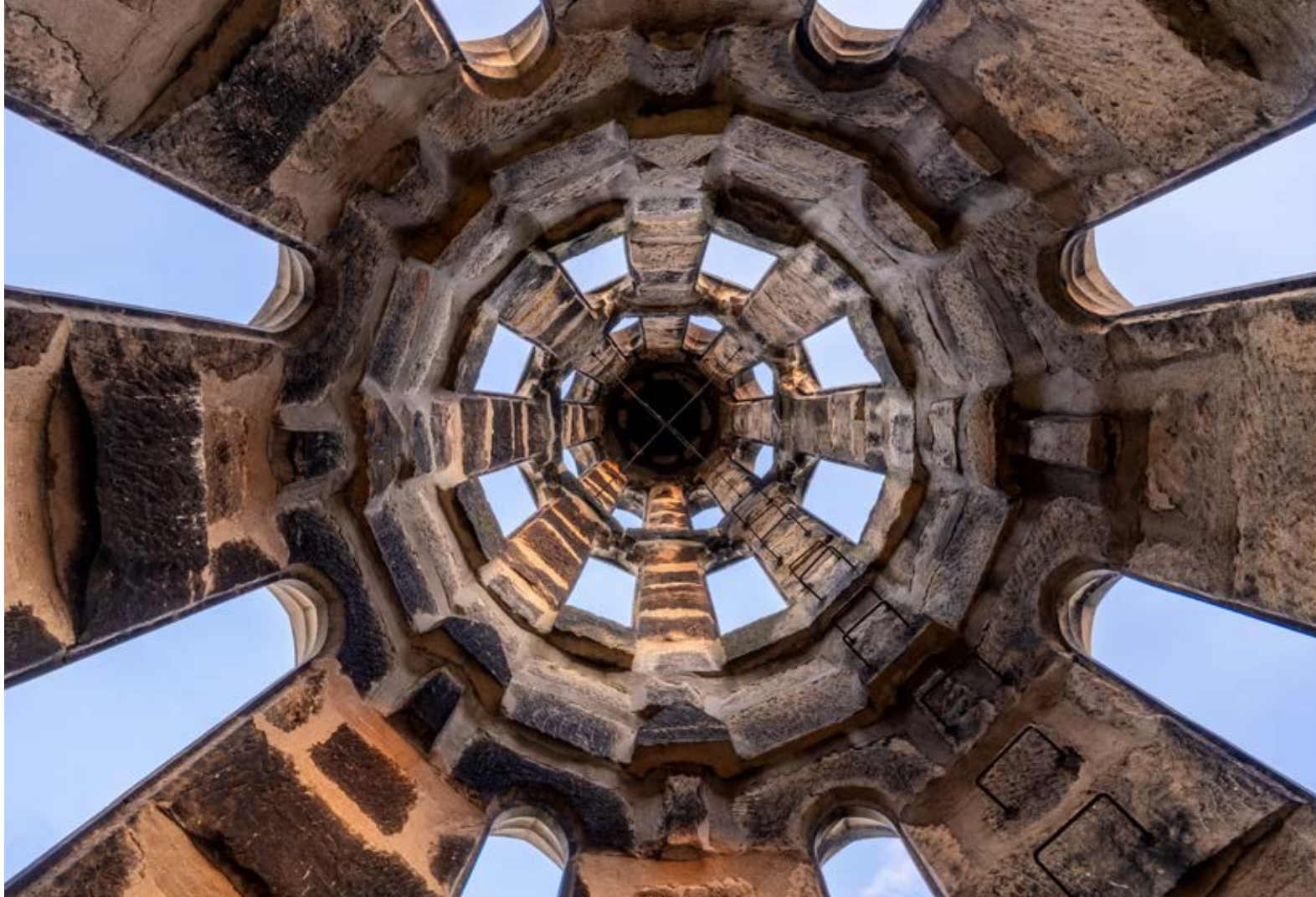
Dnešní novogotickou podobu kostela z roku 1903 projektoval Josef Mocker. Stavbu zvedl, dal prolomit štíhlá okna v bočních lodích, zboural barokní průčelí a nahradil je dvěma vysokými věžemi.

Vratislavem I., získal korunu za věrné služby a podporu Jindřicha IV., císaře Svaté říše římské. U příležitosti korunovace dostal – nejspíše od benediktinských mnichů – bohatě iluminovaný Vyšehradský kodex s biblickými výjevy.